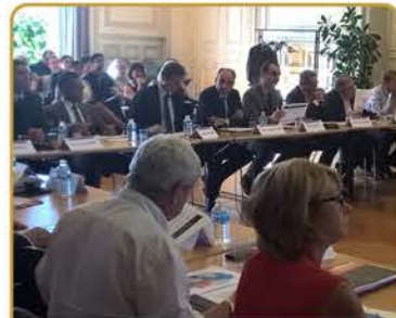
Comité de pilotage Pacte Nord-Est 77

Depuis fin 2015, 7 EPCI (le Pays de Meaux, le Pays ferrois, le Pays de l'Ourcq, les Monts de la Goële, le Pays Créçois, la Brie des Morin et récemment le Pays de Coulommiers), se sont engagées pour 3 ans, dans cette démarche partenariale.