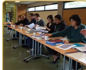
Comité technique Pacte Nord-Est 77

L'avancée de ce Pacte, tient à la mobilisation et à la forte collaboration entre les différents acteurs.