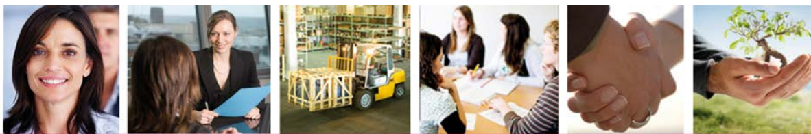
Tableau de l'offre et de la demande d'emploi sur les Territoires de la Maison de l'Emploi et de la Formation Nord-Est 77